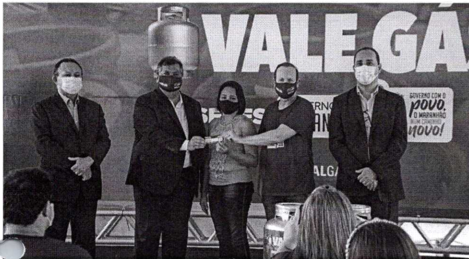
Governador Flávio Dino reforçou as parcerias para ajudar os que mais precisam durante a pandemia

O programa estadual Vale Gás teve sua primeira etapa de entregas, nesta quarta-feira (19), marcando o Dia D da ação. Em solenidade no Palácio dos Leões, o governador Flávio Dino fez a distribuição dos tíquetes a beneficiários de São José de Ribamar, Paço do Lumiar e Raposa. O benefício começou a ser entregue simultaneamente em mais 207 cidades. Ao todo 119 mil famílias serão beneficiadas. O Vale Gás integra as ações do programa Comida na Mesa, que distribuiu ainda cestas de alimentos às famílias.