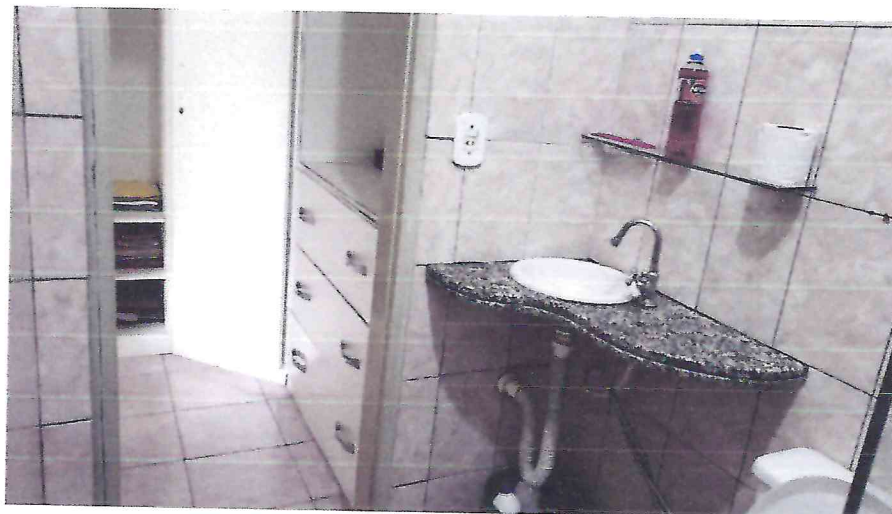
(Autoria própria, 2021)