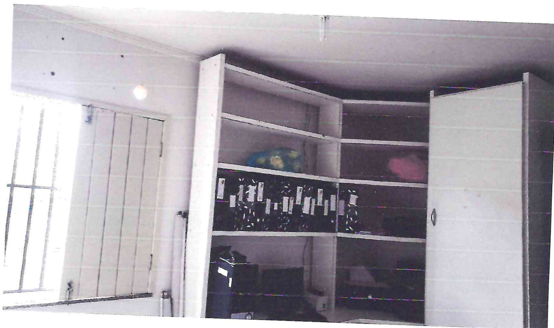
(Autoria própria, 2021)